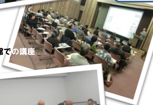
中央博物館での講座