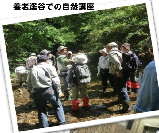
養老溪谷での自然講座