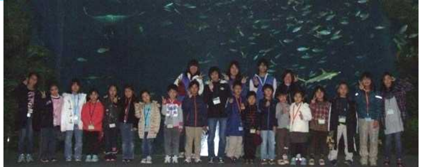
「大きな水槽の前でハイ・チーズ」