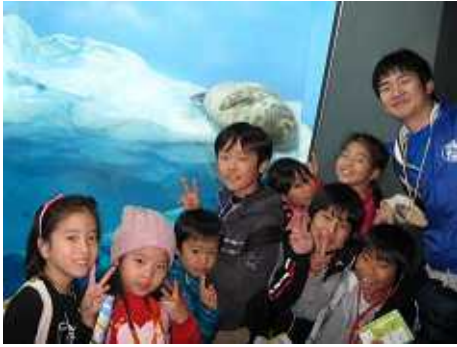
みんなで楽しく園内を探検だ