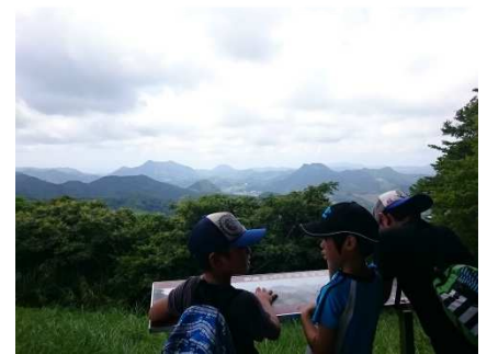
～御殿山山頂から眺める平群の里～

南房総市の平群（へぐり）地域には古くから伝わる「平群天神社祭り」があります。 提灯明かりがとっても綺麗な担ぎ屋台やお囃子を見に行こう。 また、築180年の茅葺き屋根の古民家に泊まって、周辺の里山遊びやハイキングに出かけよう！