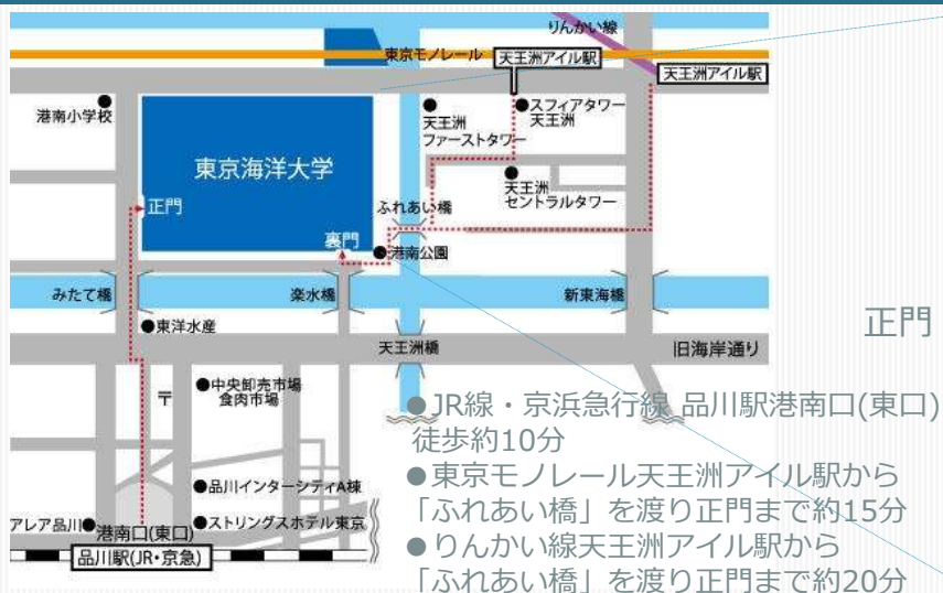
東京海洋大学品川キャンパス配置図